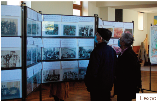
L'expo photos de classe de l'école de Viplaix a connu un franc succès.

Toutes ces manifestations ont connu un vif succès, preuve s'il en est besoin de leur attrait pour tous les publics, des plus jeunes aux plus anciens.